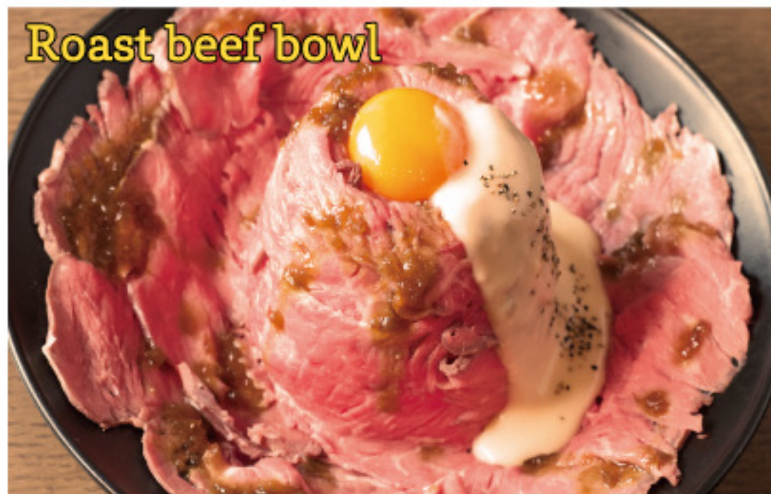
Roast beef bowl with raclette cheese sause -Meat carpet ver.- やわらかしっとり ローストビーフ丼 - ラクレットチーズソース - 肉のじゅうたん ver. (ダブル)