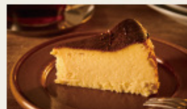
ほろ苦いあわせ うっとり パスクチーズケーキ