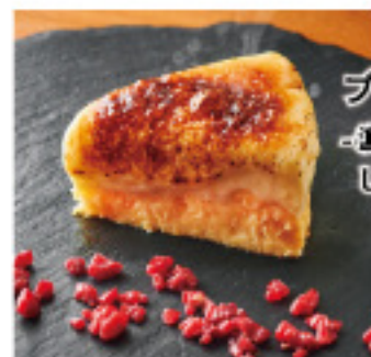
ブリュレチーズケーキ 濃厚レアチーズと しっとりバイクドの二層仕立て-