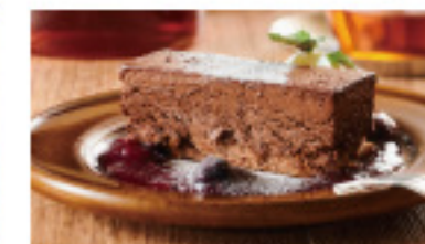
チョコ愛好家におくる 濃厚ショコラ