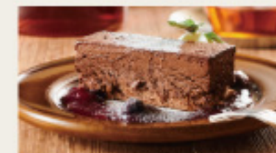
チョコ愛好家におくる 濃厚ショコラ