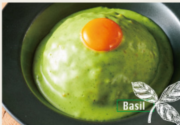
Cheese shop made basil & cheese keema curry 淡路卵 on! チーズ屋さんの 特製バジル&チーズキーマカレー