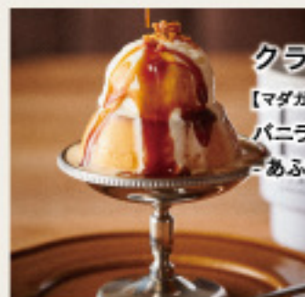
クラシックプリン 【マダガスカル産】バニラビーンズの バニラアイスのお あふれる塩キャラメルソース-