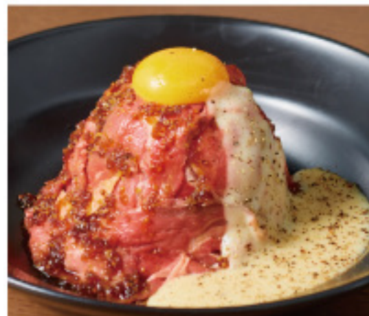
Roast beef bowl with raclette cheese sause -single- やわらかしっとり ローストビーフ丼 - ラクレットチーズソース - (シングル)