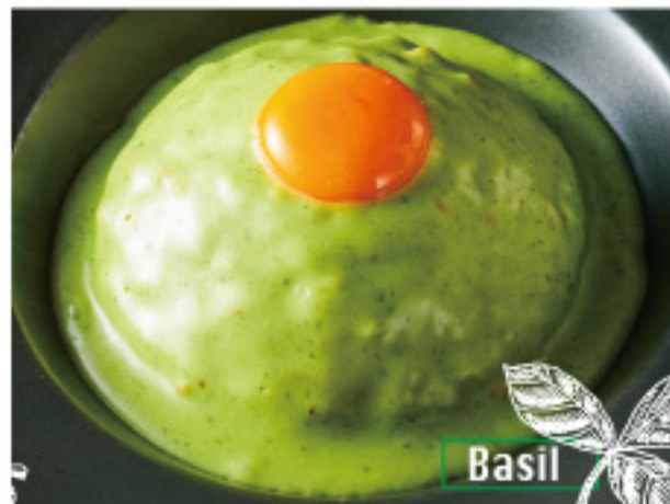
Cheese shop made basil & cheese keema curry 淡路卵 on! チーズ屋さんの 特製バジル&チーズキーマカレー