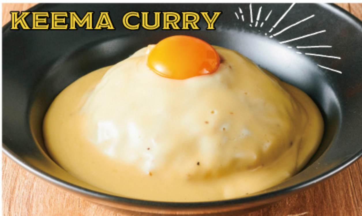
Cheese shop made original keema curry 淡路卵 on! チーズ屋さんの“特製キーマカレー” - ラクレットチーズソース -