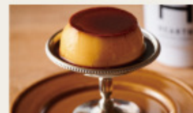
クラシックプリン