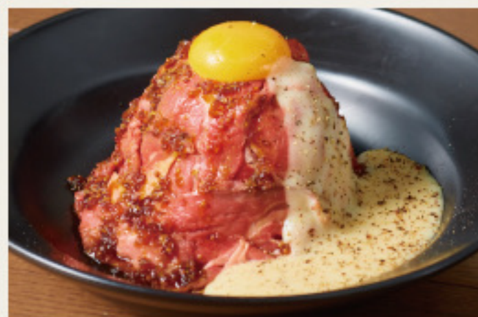
Roast beef bowl with raclette cheese sause -single- やわらかしっとり ローストビーフ丼 - ラクレットチーズソース - (シングル)