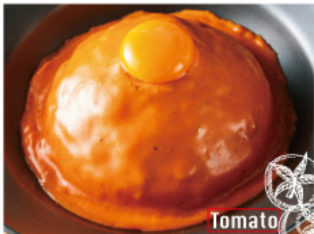
Cheese shop made tomato & cheese keema curry 淡路卵 on! チーズ屋さんの 特製トマト&チーズキーマカレー