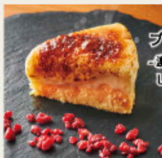
ブルーチーズケーキ 濃厚レアチーズと しっとりバイクドの二層仕立て-