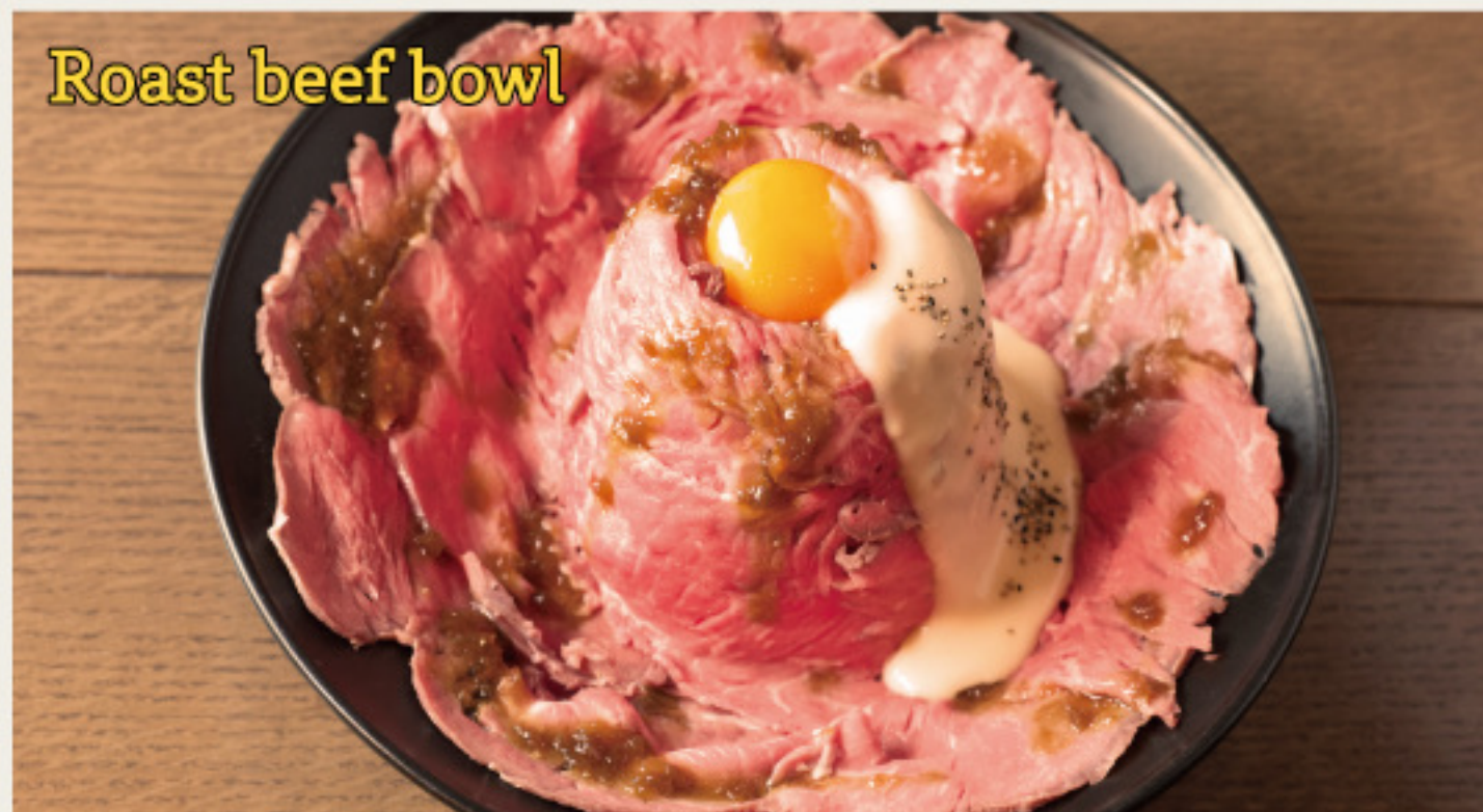
Roast beef bowl with raclette cheese sause -Meat carpet ver.- やわらかしっとり ローストビーフ丼 - ラクレットチーズソース - 肉のじゅうたん ver. (ダブル)