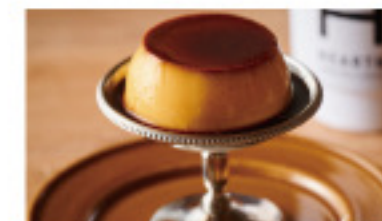
クラシックプリン