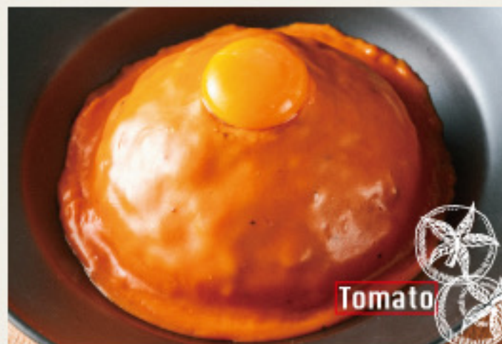
Cheese shop made tomato & cheese keema curry 淡路卵 on! チーズ屋さんの 特製トマト&チーズキーマカレー