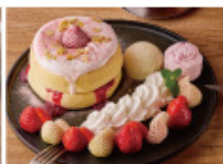
SEASONAL “AMAOU” STRAWBERRY & “TENSHI NO ICHIGO” WHITE STRAWBERRY -STRAWBERRY CASSATA-