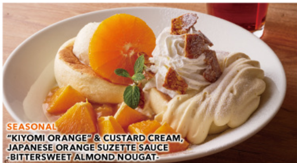
SEASONAL “KIYOMI ORANGE” & CUSTARD CREAM, JAPANESE ORANGE SUZETTE SAUCE -BITTERSWEET ALMOND NOUGAT-