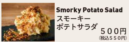
Smoky Potato Salad スモーキーポテトサラダ 500円 (税込550円)