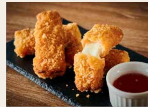
Mozzarella cheese & jamon serrano frit モッツァレラチーズの生ハムフリット 3本 680円 (税込748円) 4本 880円 (税込968円)