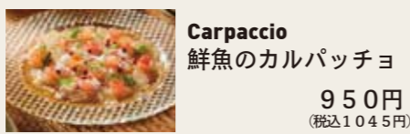
Carpaccio 鮮魚のカルパッチョ 950円 (税込1045円)