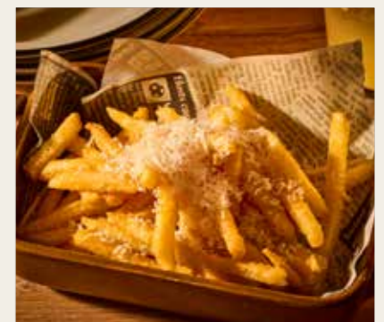
Crisp! French fries トリュフ香るカリッと！フライドポテト 790円 (税込869円)

Baguette バゲット 4枚 100円 (税込110円) 6枚 150円 (税込165円)