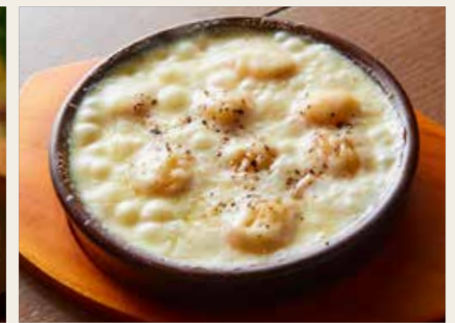
Gnocchi with raclette cheese sauce きたあかりのニョッキ - ラクレットチーズソース - 880円 (税込968円)