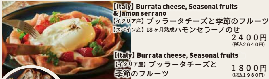
【Italy】Burrata cheese, Seasonal fruits & jamon serrano 【イタリア産】ブッラータチーズと季節のフルーツ 【スペイン産】18ヶ月熟成ハモンセラノのせ 2400円 (税込2640円)