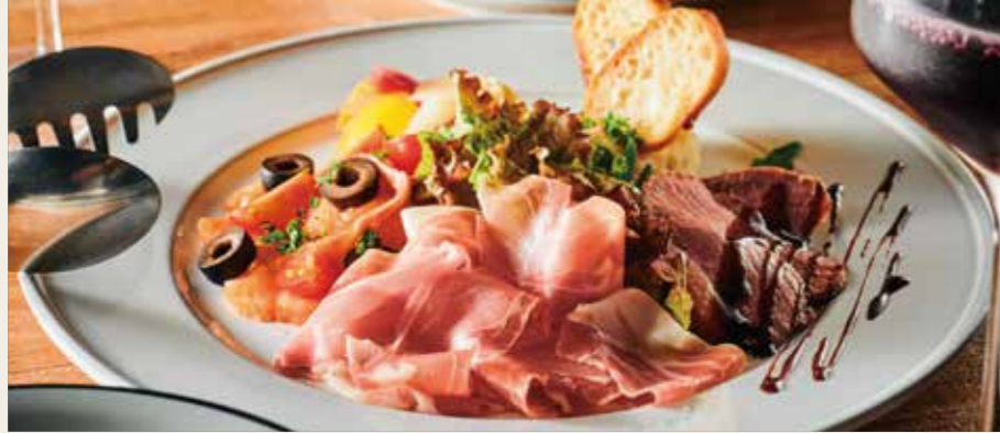
Today's Appetizer Assorted 本日の前菜 5 種盛り合わせ 1680円 (税込1848円)