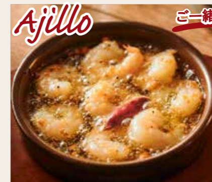
Ajillo 海老のシェリー酒風味のアヒージョ 880円 (税込968円)

Baguette バゲット 4枚 100円 (税込110円) 6枚 150円 (税込165円)