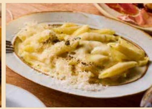
Penne Appetizer Quattro Formaggi おつまみペンネ クアトロフォルマッジョ - ラクレット・ペコリーノ ロマーノ・ブルーチーズ・パルミジャーノ レッジャーノ - 950円 (税込1045円)