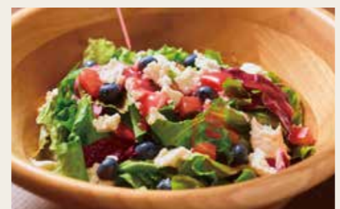
Ricotta cheese berry salad -Raspberry dressing- リコッタチーズのベリーサラダ - ラズベリードレッシング - 950円 (税込1045円)