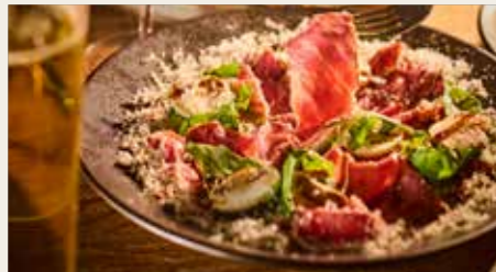
Roast beef carpaccio, with mushroom & arugula 自家製！ローストビーフ・カルパッチョ仕立て - たっぷりマッシュルームとルッコラのせ 1200円 (税込1320円)