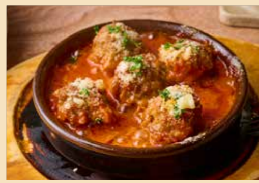
Italian-Style Meatballs "Polpettine" 旨味がぎゅっ！ローズマリー香るイタリア風肉だんご“ポルペッティニー” 5個 880円 (税込968円) 6個 980円 (税込1078円)