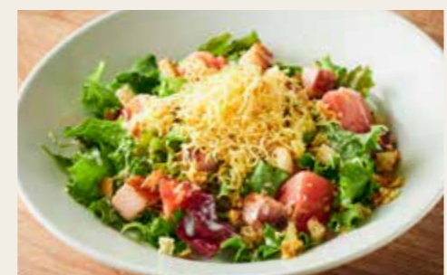
Caesar Salad Thick-cut bacon & Smoked cheddar cheese 厚切りベーコンとスモークチェダーチーズのシーザーサラダ 950円 (税込1045円)