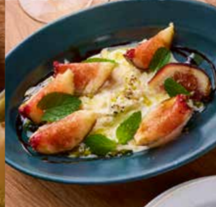
Stracciatella, Seasonal fruits ストラッチャテッラと季節のフルーツ 780円 (税込858円)