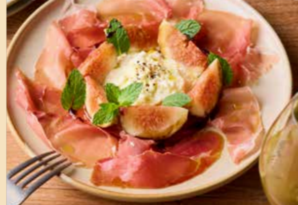
Stracciatella, Seasonal fruits & jamon serrano ストラッチャテッラと季節のフルーツ 【スペイン産】18ヶ月熟成ハモンセラノのせ 1080円 (税込1188円)

“ストラッチャテッラ” ミルクのやさしい甘みとなめらかな口どけが魅力のフレッシュチーズ。ブッラータチーズの中身をすくったような、とろける食感と贅沢感をご堪能ください。