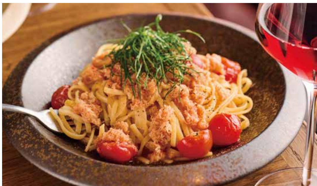
SEASONAL LINGUINE WITH SNOW CRAB & FENNEL -LOBSTER-SCENTED TOMATO BISQUE SAUCE- ズワイガニとフェネルのリングイネ - オマール香るトマトビスクソース -