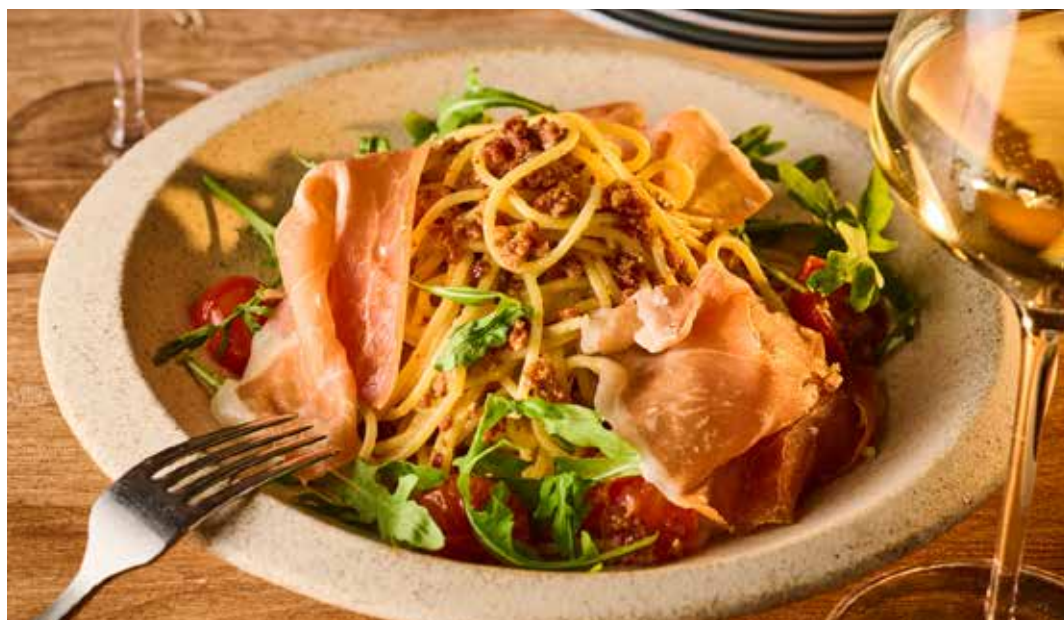
SPECIALITY PEPERONCINO JAMON SERRANO RAGOUT -JAMON SERRANO & ARUGULA- 生ハムラガーのペペロンチーノ - 【スペイン産】18ヶ月熟成ハモンセラノとセルバチコ -