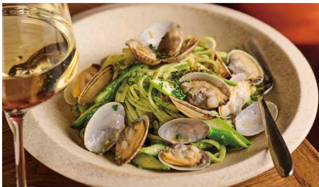
SEASONAL LINGUINE WITH CLAMS & GREEN ASPARAGUS -SALSA VERDE WITH RAPINI- アサリとグリーンアスパラのリングイネ - 菜の花サルサヴェルデ -