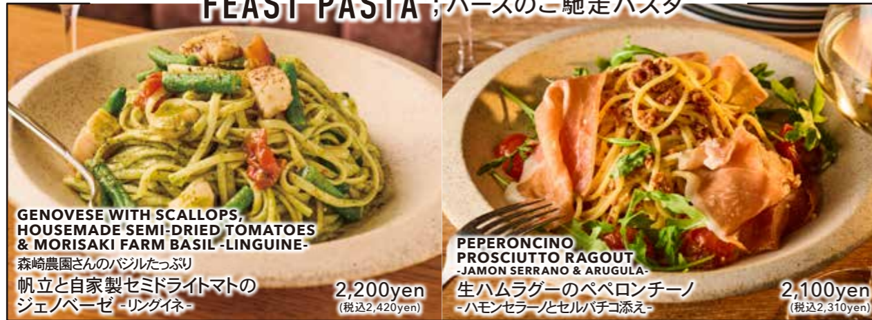
GENOVESE WITH SCALLOPS, HOUSEMADE SEMI-DRIED TOMATOES & MORISAKI FARM BASIL -LINGUINE-

森崎農園さんのバジルたっぷり 帆立と自家製セミドライマトの ジェノベーゼ -リングイネ-