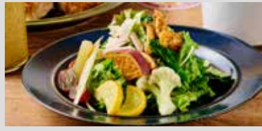
COLORFUL GARDEN SALAD -HEARTH'S ORIGINAL DRESSING- 彩り野菜のガーデンサラダ -自家製ドレッシング-