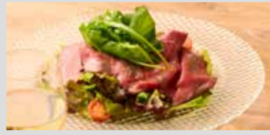
ROAST BEEF SALAD -HEARTH'S ORIGINAL DRESSING- 【国産】黒毛和牛の しっとりローストビーフサラダ -自家製ドレッシング-