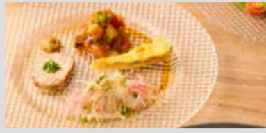
ASSORTED APPETIZER 前菜盛り合わせ