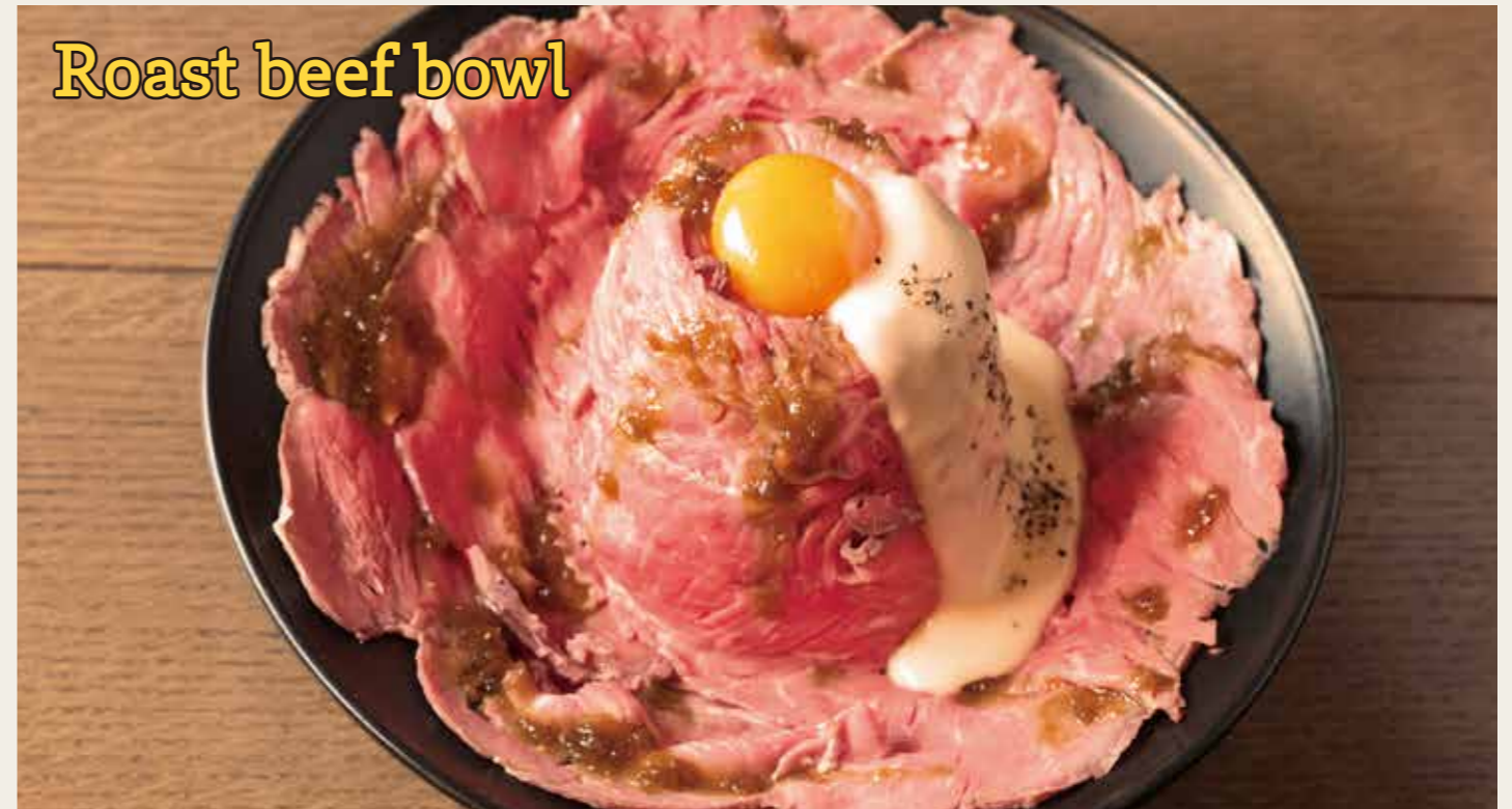
Roast beef bowl with raclette cheese sause -Meat carpet ver.- やわらかしっとり ローストビーフ丼 - ラクレットチーズソース - 肉のじゅうたん ver. (ダブル)