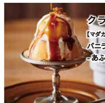
クラシックプリン [マダガスカル産] バニラビーンズの バニラアイスの上 -あふれる塩キャラメルソース-