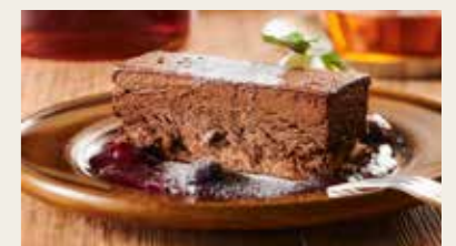
チョコ愛好家におくる 濃厚ショコラ