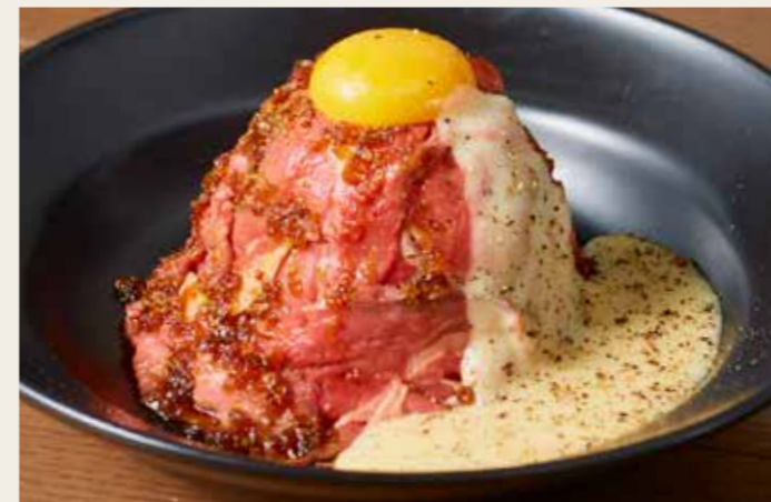
Roast beef bowl with raclette cheese sause -single- やわらかしっとり ローストビーフ丼 - ラクレットチーズソース - (シングル)