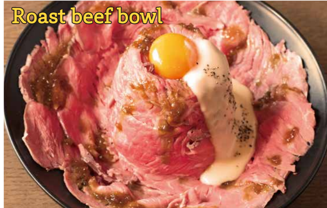
Roast beef bowl Roast beef bowl with raclette cheese sause -Meat carpet ver.- やわらかしっとり ローストビーフ丼 - ラクレットチーズソース - 肉のじゅうたん ver. (ダブル)