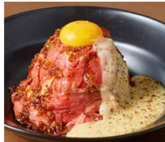
single Roast beef bowl with raclette cheese sause -single- やわらかしっとり ローストビーフ丼 - ラクレットチーズソース - (シングル)