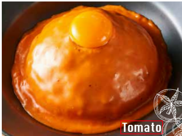
Tomato Cheese shop made tomato & cheese keema curry 淡路卵 on! チーズ屋さんの 特製トマト&チーズキーマカレー