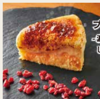
ブリュレチーズケーキ -濃厚レアチーズと しっとりバイクドの二層仕立て-