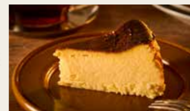
ほろ苦いあわせ うっとり バスクチーズケーキ