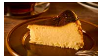
ほろ苦いしあわせ うっとり バスクチーズケーキ