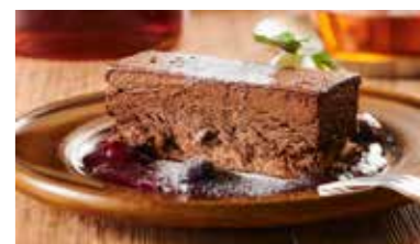
チョコ愛好家におくる 濃厚ショコラ