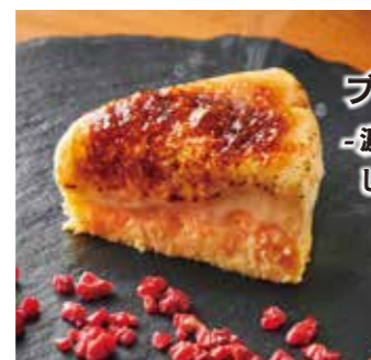
ブリュレチーズケーキ -濃厚レアチーズと しっとりペイクドの二層仕立て-