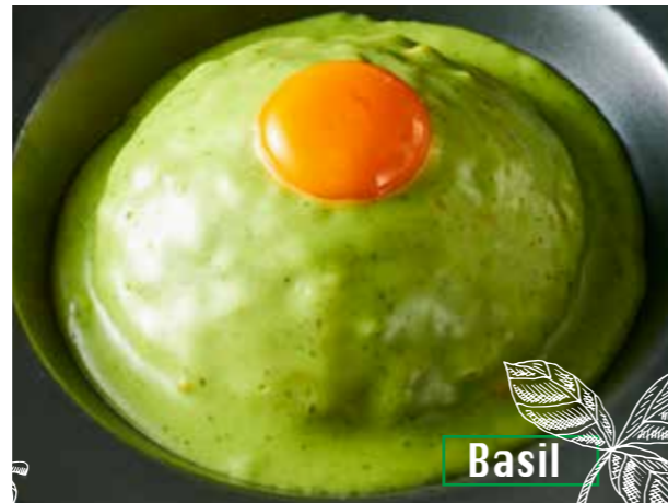
Basil Cheese shop made basil & cheese keema curry 淡路卵 on! チーズ屋さんの 特製バジル&チーズキーマカレー