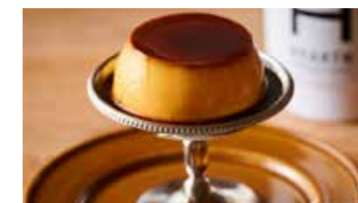
クラシックプリン