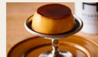
クラシックプリン