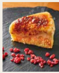
Brulee Cheesecake ブリュレチーズケーキ -濃厚レアチーズととっとりペイクドの二層仕立て- 750円 (税込825円)