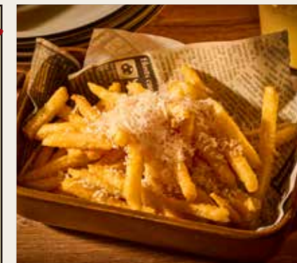
Crisp! French fries トリュフ香るカリッと！ フライドポテト 790円 (税込869円)

Baguette バゲット 4枚 100円 (税込110円) 6枚 150円 (税込165円)