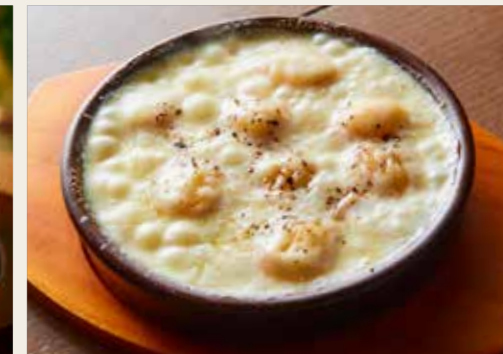
Gnocchi with raclette cheese sauce きたあかりのニョッキ - ラクレットチーズソース - 880円 (税込968円)