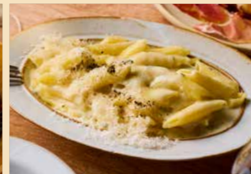
Penne Appetizer Quattro Formaggi おつまみペンネ クアトロフォルマッジョ - ラクレット・ペコリーノ ロマーノ・ブルーチーズ・パルミジャーノ レッジャーノ - 950円 (税込1045円)