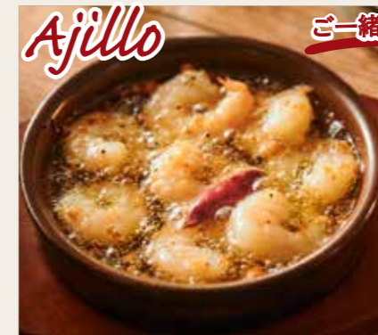
Shrimp sherry flavored Ajillo 海老のシェリー酒風味のアヒージョ 880円 (税込968円)

Baguette バゲット 4枚 100円 (税込110円) 6枚 150円 (税込165円)