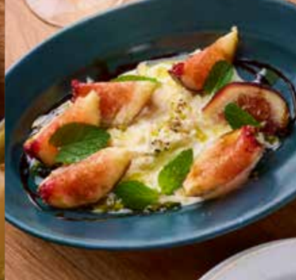
Stracciatella, Seasonal fruits ストラッチャテッラと季節のフルーツ 780円 (税込858円)