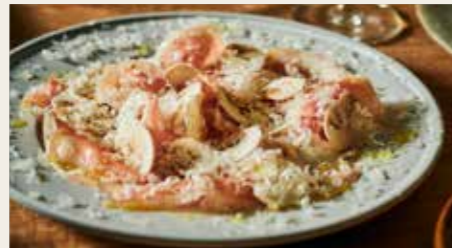
Spanish jamon serrano, with mushroom & Parmesan 【スペイン産】14ヶ月熟成ハモンセラノとたっぷりマッシュルーム、パルミジャーノがけ 1000円 (税込1100円)