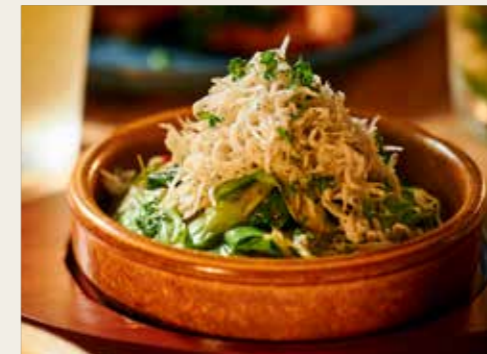
Shirasu Anchovy Cabbage 釜揚げしらすのアンチョビキャベツ 680円 (税込748円)