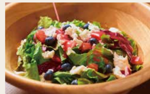
Ricotta cheese berry salad -Raspberry dressing- リコッタチーズのベリーサラダ -ラズベリードレッシング- 950円 (税込1045円)