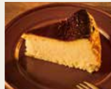
Melting Basque Cheesecake ほろ苦いあわせ うっとりバスクチーズケーキ 750円 (税込825円)