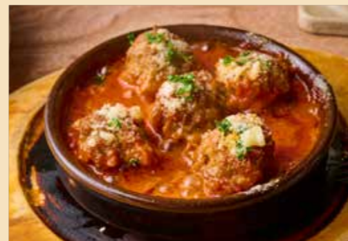
Italian-Style Meatballs "Polpettine" 旨味がぎゅっ！ローズマリー香る イタリア風肉だんご “ポルペッティニー” 5個 880円 (税込968円) 6個 980円 (税込1078円)