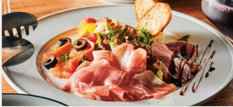
Today's Appetizer Assorted 本日の前菜 5 種盛り合わせ おすすめの前菜を少しずつシェアできる、美味しさも彩りもコスパも◎な一皿。 1680円 (税込1848円)