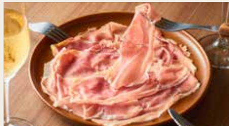
Spanish jamon serrano 【スペイン産】14ヶ月熟成ハモンセラノ 800円 (税込880円)