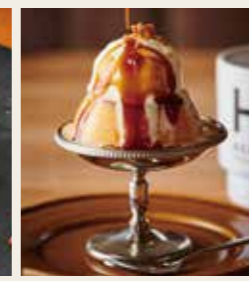
Classic Pudding with Vanilla Icecream -Salted caramel sauce- クラシックプリン 【マダガスカル産】バニラビーンズのバニラアイス のせ -あふれる塩キャラメルソース- 850円 (税込935円)