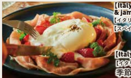
【Italy】 Burrata cheese, Seasonal fruits & jamon serrano 【イタリア産】ブルータチーズと季節のフルーツ 【スペイン産】14ヶ月熟成ハモンセラノのせ 2400円 (税込2640円)