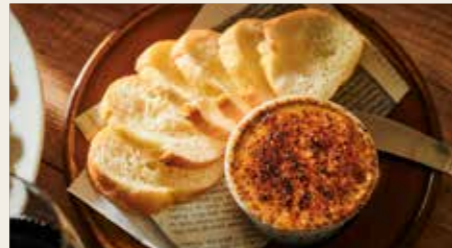
Dried Fruit Honey Cheese 大人のブリュレ仕立て ハニーチーズ・ドライフルーツ入り 550円 (税込605円)