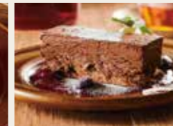
Rich Chocolate For Chocolate Lovers チョコ愛好家におくる濃厚ショコラ 650円 (税込715円)