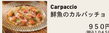
Carpaccio 鮮魚のカルパッチョ 950円 (税込1045円)