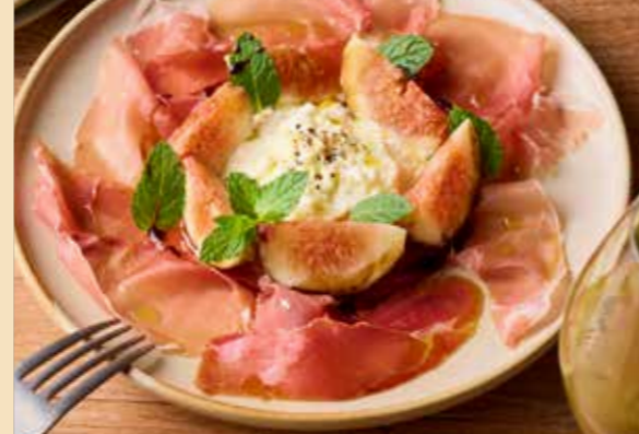
Stracciatella, Seasonal fruits & jamon serrano ストラッチャテッラと季節のフルーツ 【スペイン産】14ヶ月熟成ハモンセラノのせ 1080円 (税込1188円)

“ストラッチャテッラ” ミルクのやさしい甘みとなめらかな口どけが魅力のフレッシュチーズ。ブルータチーズの中身をすくったような、とろける食感と贅沢感をご堪能ください。