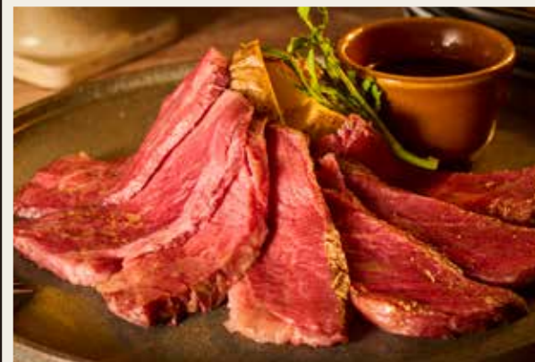
Wagyu Top Round Steak 【国産】和牛うちも肉ステーキ