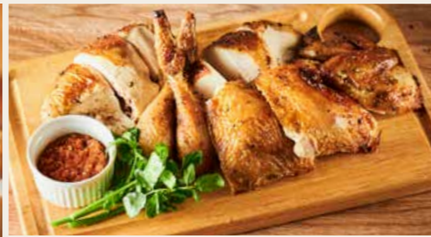
Rotisserie Chicken ロティサリーチキン

ご自宅でも当店の味をお楽しみ下さい！ *当日残ったチキンのお持ち帰りも承っています。