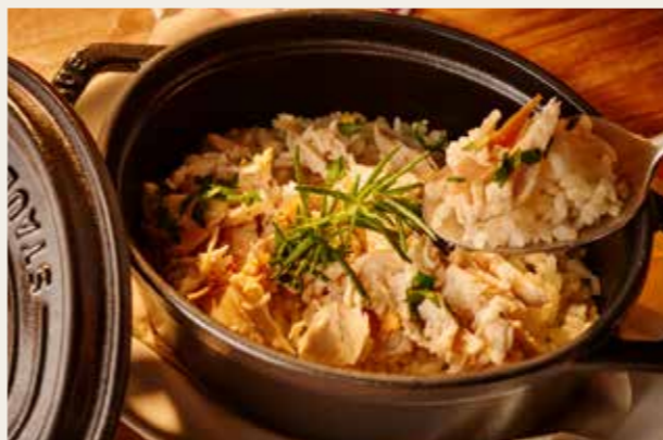
Rice cooked in a cocotte with Housemade chicken broth チキン屋の!ローズマリー香る 自家製チキンブイヨンのココットごはん

ご注文いただいたから、自慢の“自家製鶏出汁”で一気に炊き上げ! 鶏の旨みをぎゅっ!と閉じ込めたアルデンテ食感。シメに是非!