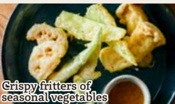
Crispy fritters of seasonal vegetables