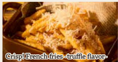
Crisp! French fries - truffle flavor -

トリュフ香る カリッと! フライドポテト 800円 (税込880円) - ふんわりパルミジャーノがけ -