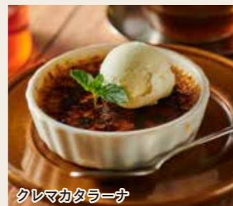
クレマカタラーナ

Rich Chocolate For Chocolate Lovers チョコ愛好家におくる 濃厚ショコラ 8 0 0 円 (税込880円)