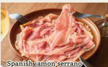
Spanish jamon serrano

本日季節の 鮮魚のカルパッチョ *詳しくはスタッフまでお気軽に! 950円~ (税込1045円~)