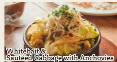
Whitebait & Sautéed Cabbage with Anchovies

Lamb Steak - Onion Garlic Sauce - 柔らか ラム肉ステーキ - オニオンガーリックソース - 980円 (税込1078円)