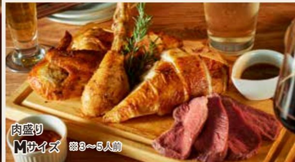
肉盛り M サイズ ※3~5人前