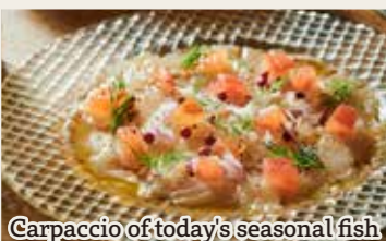
Carpaccio of today's seasonal fish

Chilled Roasted Ratatouille 香ばしさと野菜の甘み 冷製 焼きラタトゥイユ 550円 (税込605円)