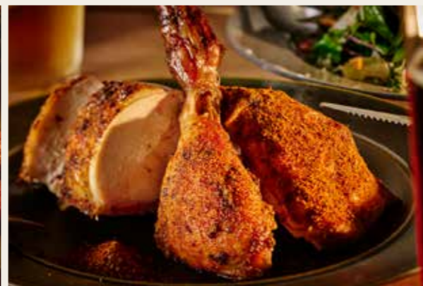
Spicy chicken スパイシーチキン 4ピース (1/3羽)

自慢のロティサリーチキンに、やみつき注意の新定番。ケイジャンスパイスの香りがクラフトビールと相性抜群!