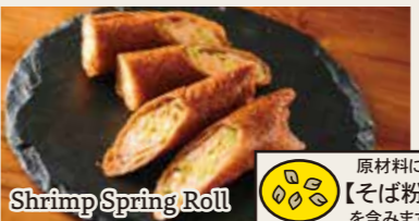
Shrimp Spring Roll

トリュフ香る カリッと! フライドポテト 800円 (税込880円) - ふんわりパルミジャーノがけ -