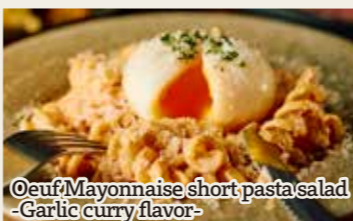
Oeuf Mayonnaise short pasta salad

とろ〜りウフマヨの ショートパスタサラダ - ガーリックカレー風味 - 630円 (税込693円)