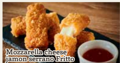
Mozzarella cheese jamon serrano Fritto