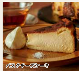
バスクチーズケーキ