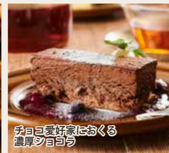
チョコ愛好家におくる濃厚ショコラ