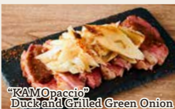
"RAM Opaccio" Duck and Grilled Green Onion

【スペイン産】14ヶ月熟成 味わいとコク ハモンセラノ 1200円 (税込1320円)